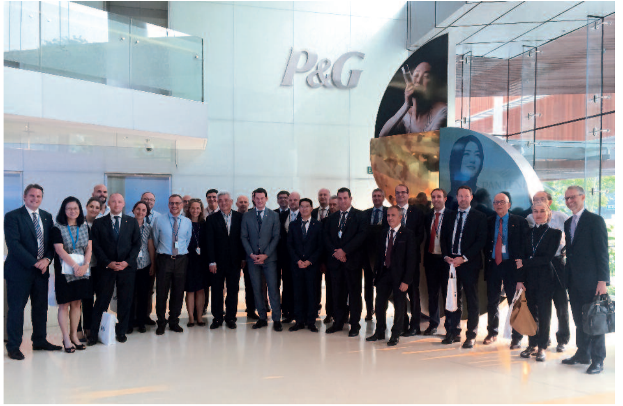
Visite du R&D Center de Procter & Gamble à Singapour, pendant du remarquable centre de recherche genevois de la multinationale.

à l'ouverture du salon SIBOS, véritable « Telecom de la finance », dont Genève accueillera les 8000 participants qui y sont attendus en 2016 et – espérons-le – au gré de futures éditions de ce salon. Représentant des retombées de l'ordre de CHF 65 millions, un tel événement offre par ailleurs à Genève une vitrine unique à son expertise historique et unanimement reconnue dans le domaine financier (y compris en matière de « fintech »).