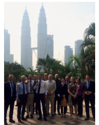
Devant les tours Petronas de Kuala Lumpur, emblème de la vitalité de la capitale malaisienne.

Comme en attestent les témoignages recueillis (voir ci-après), la mission a rencontré un vif succès auprès des participants; ainsi, des perspectives tangibles de collaboration avec des entrepreneurs locaux et des gains concrets paraissent avoir été engrangés au cours de cette opération au long cours, qui – au-delà de toute équation arithmétique – a également été marquée par un esprit éminemment sympathique; l'esprit de Genève! ■