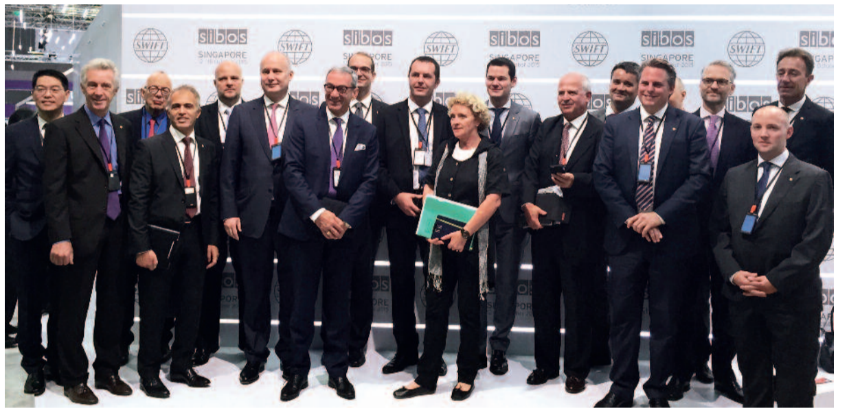
Ouverture officielle à Singapour du salon SIBOS, dont l'édition 2016 se tiendra à Genève.

Les membres de la délégation purent également prendre la mesure du dynamisme hors norme de Singapour, à la faveur d'une visite