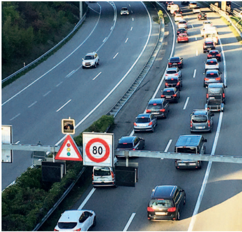
Les bouchons aux heures de pointe, une difficulté bientôt régulée par taxation ?

Le projet de mise en place d'une tarification de la mobilité (mobility pricing) fait son chemin à Berne: il s'agit potentiellement d'une refonte totale du financement des infrastructures de transports sur la base d'une redevance kilométrique. Où en est le projet et quelles sont les conséquences attendues pour la mobilité et les entreprises genevoises? Le point sur la question.