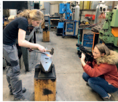
Médiatiser les métiers méconnus a un impact auprès des jeunes.

Réseaux sociaux, presse écrite, internet et maintenant télé et radio, tous les moyens sont bons pour s'informer. Chaque tranche d'âge consomme l'information différemment. Message bien reçu pour le Service de l'information scolaire et professionnelle (SISP) : en ce début 2020, deux nouvelles collaborations avec les médias locaux viennent étoffer la palette des canaux de diffusion de l'information, sous l'égide de l'Association Cité des Métiers et de la Formation, à laquelle sont également associés les partenaires sociaux et l'Etat.