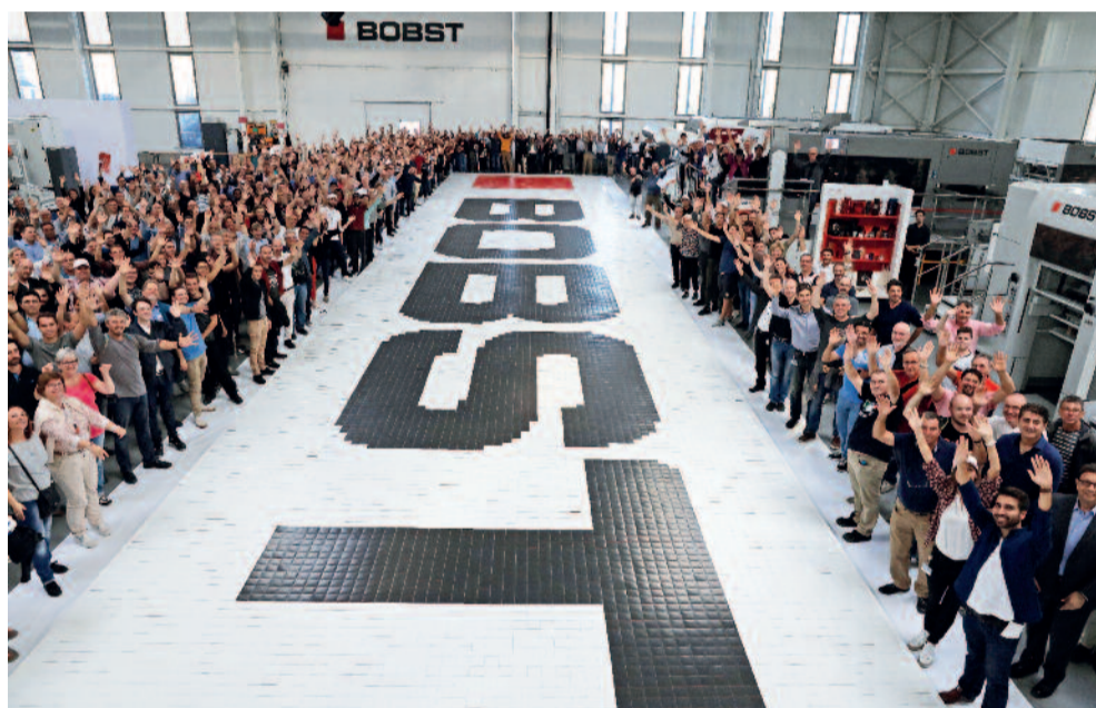
Fête du personnel 2018 – Record Guinness book