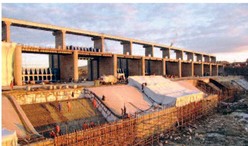
Construction du barrage de Intumak au Kazakhstan.