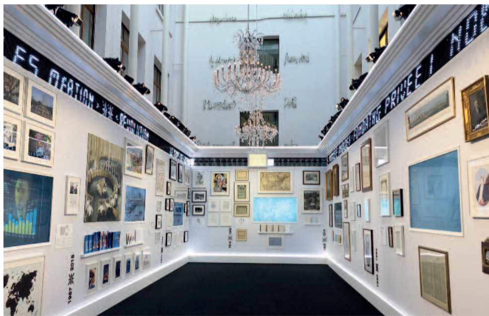
Banque Lombard Odier – 222 e anniversaire