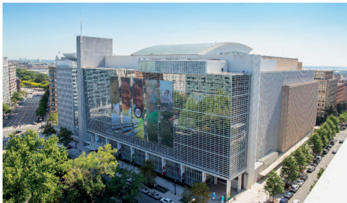
Le bâtiment où siège la Banque mondiale à Washington DC.