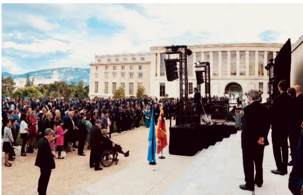
Organisation Mondiale de la Santé – 70 e anniversaire

Forte de plus de 30 années d'expérience dans l'événementiel, la société Skynight accompagne ses clients, agences et sociétés, sur tous les terrains de jeu dès lors qu'un simple micro ou un dispositif audiovisuel complexe soit nécessaire à la réalisation d'un événement. Peu importe la taille du projet, nous conseillons avec la même expertise, la même passion, la même disponibilité, la même efficacité.