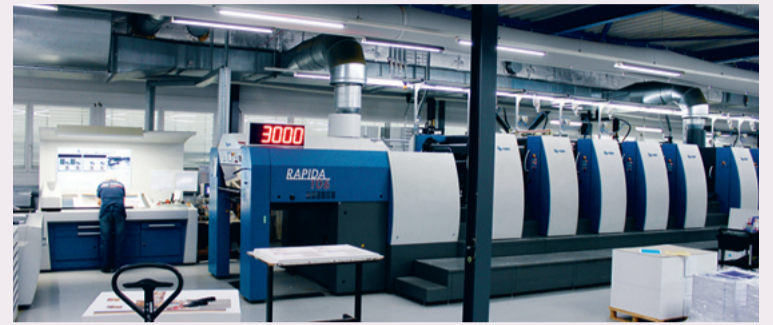
Presse offset Rapida 106 qui utilise des encres sous rayonnement UV, dont le séchage instantané permet un rendu chatoyant et lumineux sans contraintes liées aux supports.

Mais Atar ne s'arrête pas là. Outre son adhésion au programme Optima Len