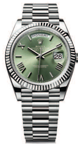
OYSTER PERPETUAL DAY-DATE 40 EN OR GRIS 18 CT