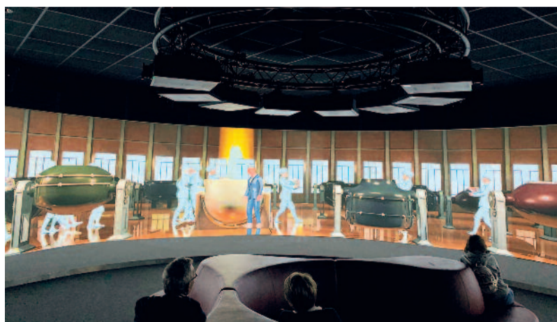
Musée Camille bloch.

POUR PLUS D'INFORMATIONS : www.skynight.com